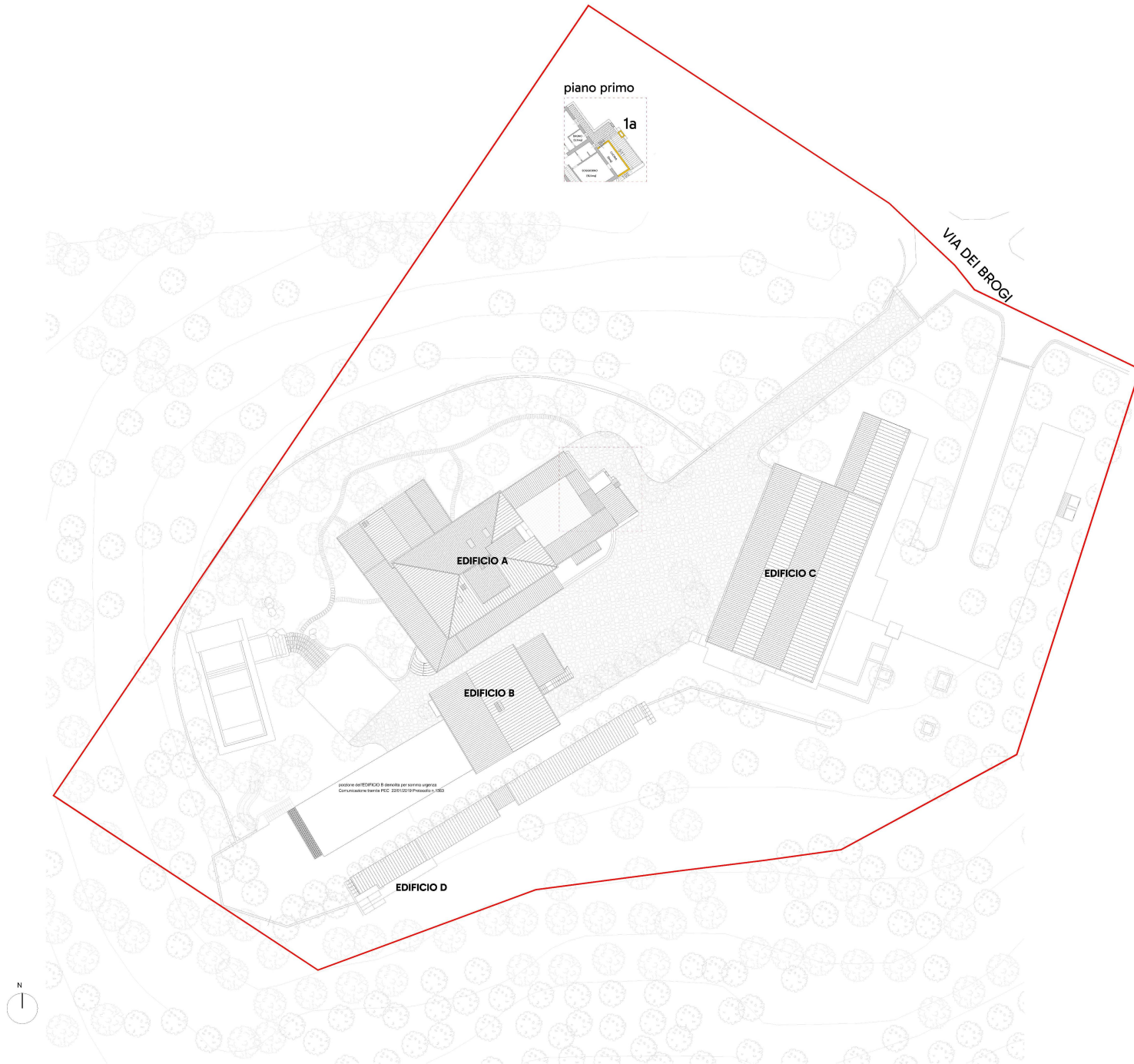
Planimetria STATO ATTUALE