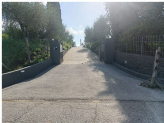
Punto di vista 1