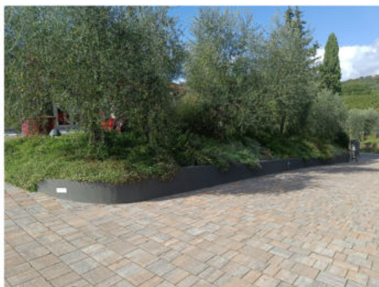
Punto di vista 3