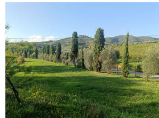
Punto di vista 5