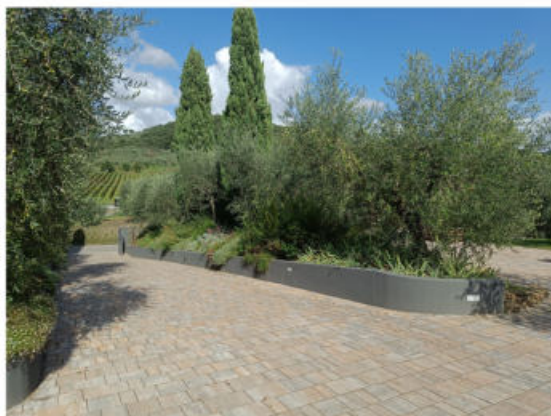
Punto di vista 2