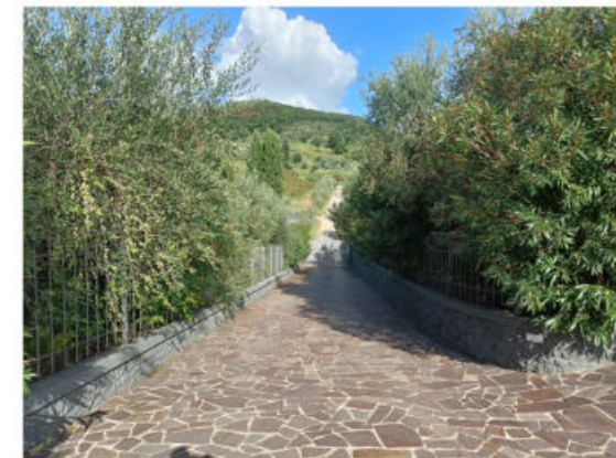
Punto di vista 4

■ Superfici piantumate con essenze arboree