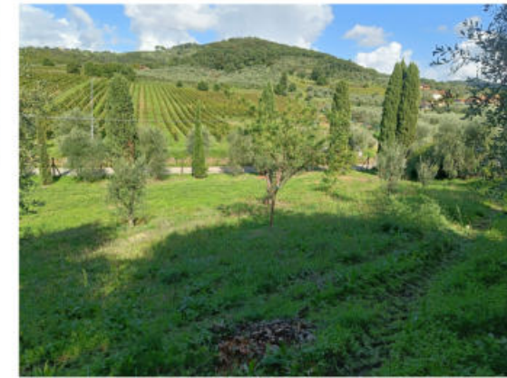
Punto di vista 6